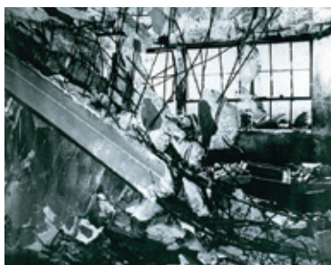
校舎1階の梁と床崩壊:C