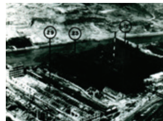
茂里町三菱兵器工場:E