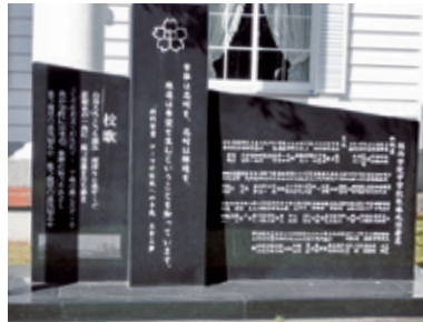
原子爆弾死没者慰霊碑 The-Monument of A-bomb Victims