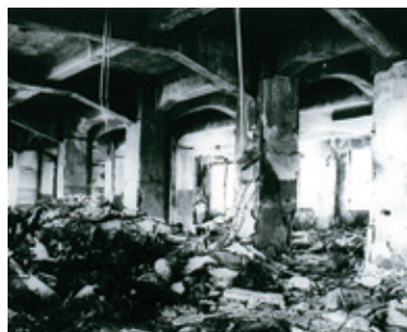
校舎2階爆風と火災による室内の損傷:C