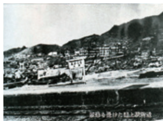
原爆を受けた浦上駅附近