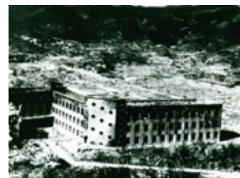
破壊した城山国民学校一帯:E