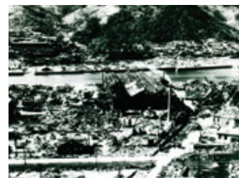
三菱造船所幸町一帯:E