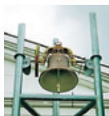
平和の鐘 Peace Bell