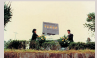
平和祈念碑除幕式