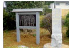
鎮西学院の平和の象徴「校訓の碑」 The Monument of Chinzei Gakuin's Motto - The Symbol of Peace -