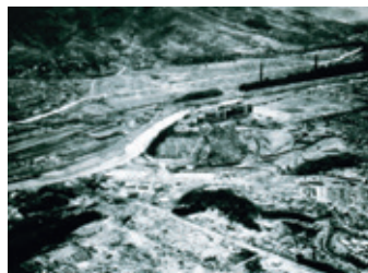
鎮西学院周辺城山2丁目 三菱城山寮跡:E