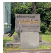
平和祈念碑 Peace Memorial Monument