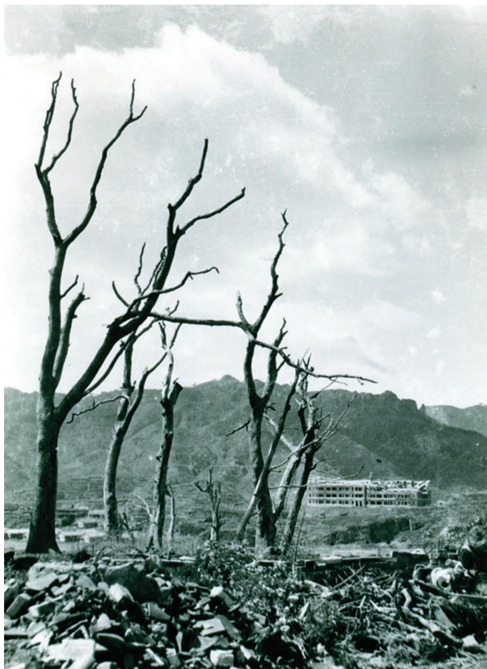
廃墟の中に見える鎮西学院の被爆校舎(現在の活水中学・高等学校): B