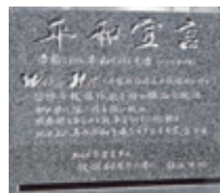
平和宣言の碑 Peace Declaration Monument