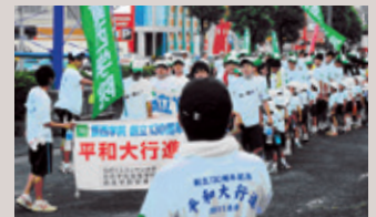
創立130周年記念平和大行進(長崎ー諫早30km)