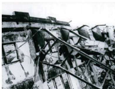
校舎北側4階部分の被害:E