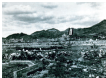
爆心地松山町一帯:B

長崎の街は午前11時2分1発の原子爆弾が炸裂し、一瞬のうちに焼け野原となった。市内全体に紫色を帯びた黒煙らしいものが一面に立ち込め、天日もそのため暗い。正にこの世の地獄である。爆心地西方約500mの丘の上にあった鎮西学院は、即死68名、後日死35名、生存者僅か15名であった。鎮西学院校庭で被爆直後運動場の真中に誰か1人、東方を向いて正座している、気が狂ってわけのわからない事をわめきながら走り回っている者もいた。今も残る「1本足鳥居」。原爆の威力のすごさをあますことなく伝えている。建物全体が一瞬のうちに破壊され、その後の火災と高度の放射能障害のため多くの方々が亡くなった。熱線と爆風により、多くの人は水ぶくれの背中、垂れ下がった皮膚、血まみれの皮膚をふるわせていた。アイゴーアイゴーと泣き叫ぶ声、朝鮮人被爆者の方々もいた。