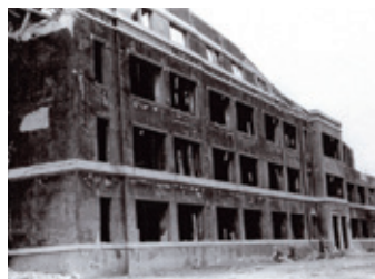
鎮西学院校舎東壁:A