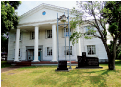
鎮西学院本部棟 (平和の鐘、平和宣言の碑、原子爆弾死没者慰霊碑) Head Office of Chinzei Gakuin