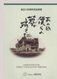
旧制鎮西学院中学校原爆投下当時在校生名簿・被爆記録誌「あの日僕らの夢が消えた」