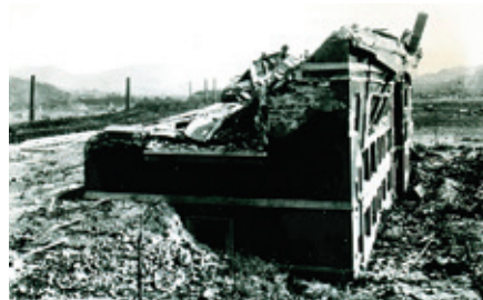
原爆被災後の竹の久保校舎・C