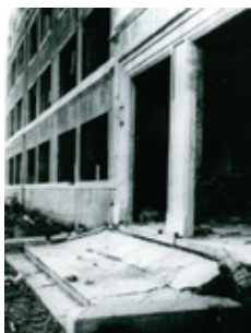
校舎東側玄関付近:E

参考文献：「浦上原頭の廃虚の中より……鎮西学院創立110周年記念事業・原子爆弾被災記録集」（千葉胤雄先生の日記、鎮西学院発行、1991年）