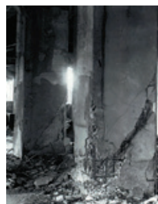
校舎1階内部柱の崩壊:C