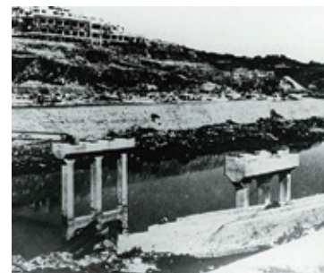
原爆で破壊された竹岩橋と鎮西学院