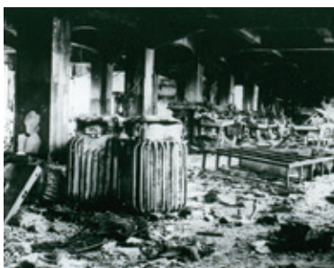
校舎1階内部の損傷:E