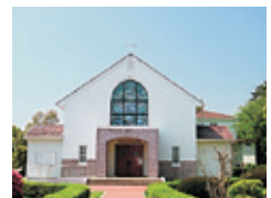
ピースチャペル Peace Chapel