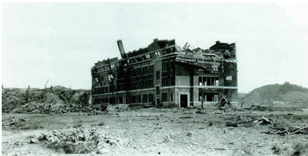
鎮西学院中学校校舎南西側より見る:D